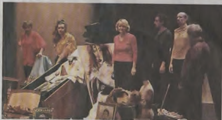
Les acteurs de la Cie Les Barbares dans le fouillis des objets d'antan.