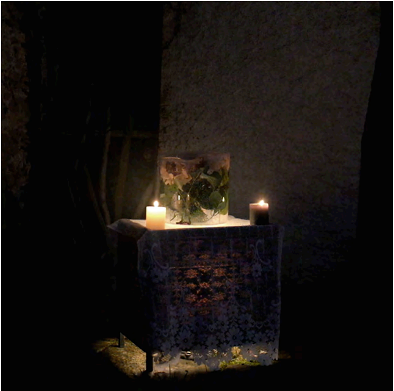
L'autel placé à l'entrée de la maison pour l'accueil du public