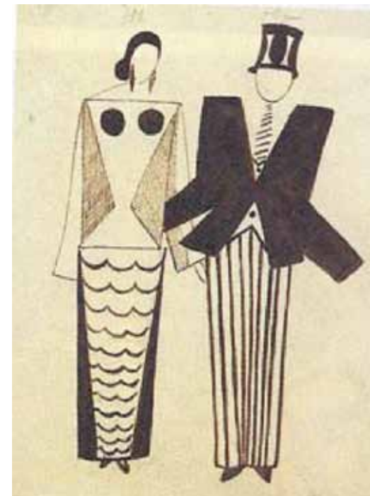
Sonia Delaunay, Mme Bouche et M. Oeil , 1923